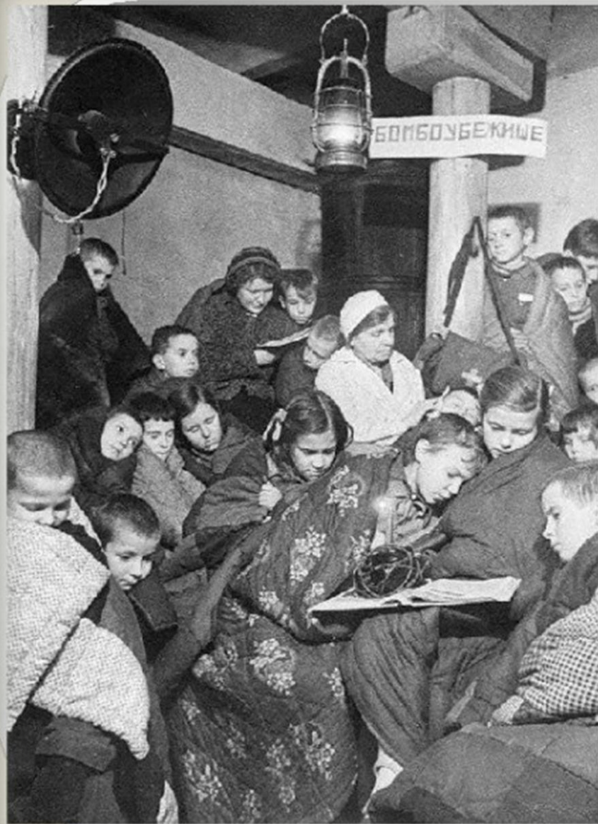
Бомбоубежище в Ленинграде