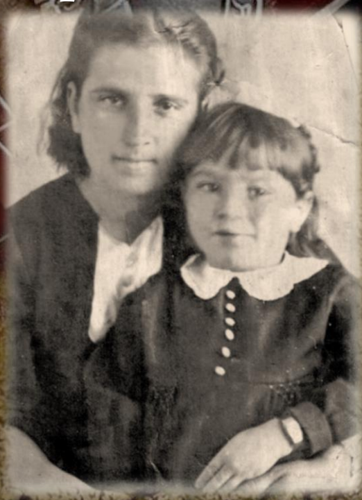
1945 г. Света с мамой после возвращения из плена

В начале 1941-го года наша семья переехала жить с Урала в Белоруссию, в город Витебск.